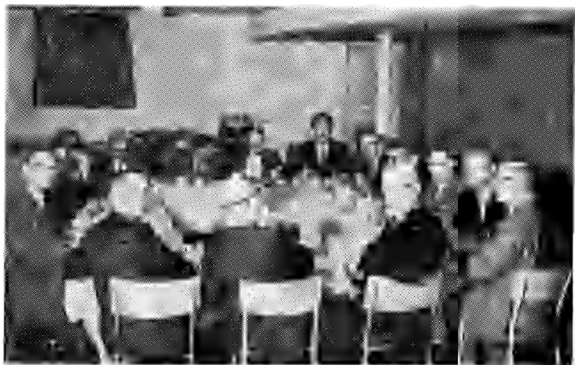
Abend zitting: tussen de zittingen der Kamer in 'verbeiding'.